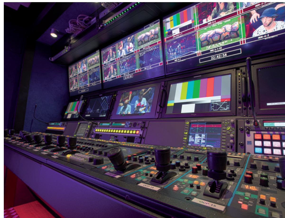
L'area di controllo tecnico, con in primo piano i CCU delle camere. La scelta è ricaduta in questo caso, sulle camere Sony 4K HDR, modello HDC-4300. E' possibile controllare fino a 30 camere.

La scelta è caduta sul sistema RTS, anche per la loro grande disponibilità nel supportarci. Per questo sistema, sono installati 31 pannelli ma è possibile integrare altri 20 pannelli esterni. Sono ben 256 canali suddivisi su 4 schede, per avere la dovuta ridondanza, per ogni evenienza.