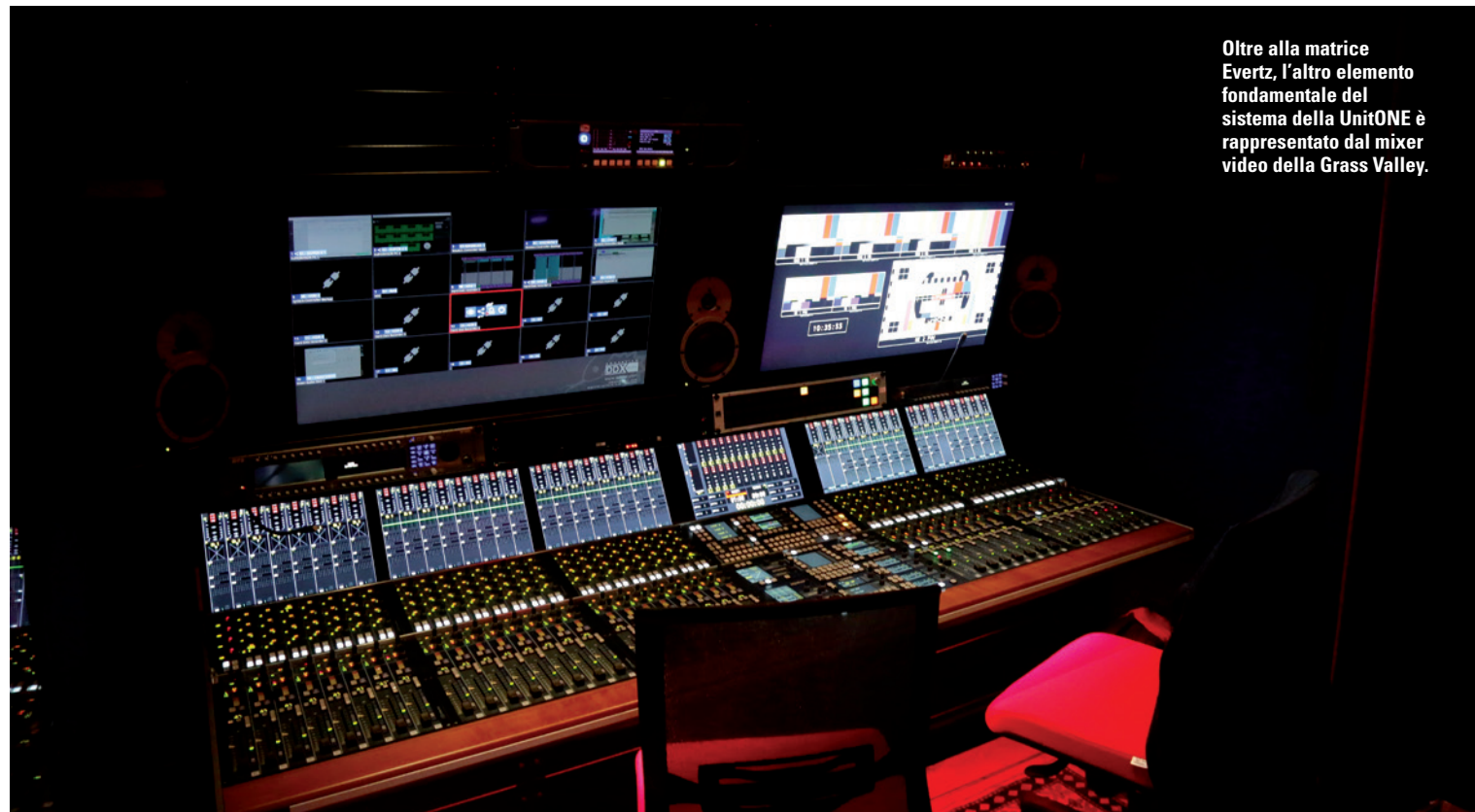
Oltre alla matrice Evertz, l'altro elemento fondamentale del sistema della UnitONE è rappresentato dal mixer video della Grass Valley.